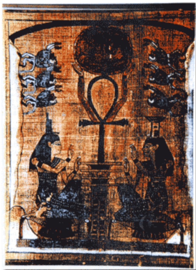
Ägypten: Mittleres Reich

GEA ist die Abkürzung für Gravitationsfeld-Energie-Akkumulatoren.