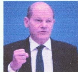
Bundeskanzler Olaf Scholz siehe unten Link 2