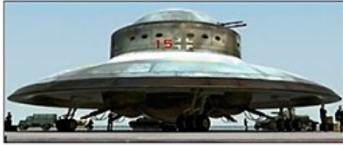
Haunebu II 1944/45 Neuschwabenland